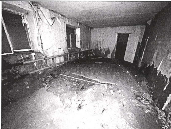
Пом. № 9 ТП от 16.12.2008