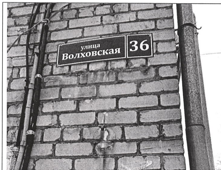
Адресная привязка объекта